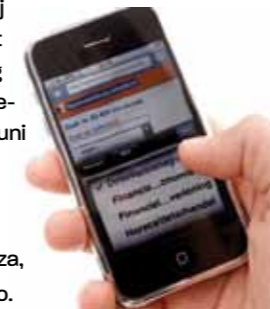
Mobiel reserveren en betalen allang geen toekomstmuziek meer

Een drankje bestellen en betalen met de mobiele telefoon kan deze zomer in Noordwijk met MyOrder. Dit is een innovatieve dienst, waarmee met de mobiele telefoon bij horecagelegenheden de menukaart bekeken kan worden, een bestelling geplaatst en ook meteen mobiel betaald kan worden. Vanaf zondag 21 juni is dit mogelijk bij negen strandpaviljoens in Noordwijk: Alexander Beach, De Klink, De Strandgans, De Zeemeeuw, De Zeester, Palm Plaza, J. van Rhooen, Nederzandt en Bell'agio.