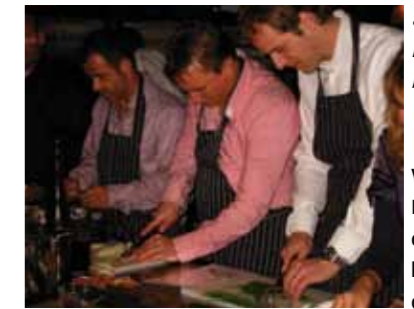
Snij niet in je vingers! NOV Jong ingespannen bezig in de Kookerij

Woensdag 11 maart hield NOV Jong een training in de Kookerij te Noordwijkerhout. Het thema van de avond was 'samenwerking'. Meer dan 60 Noordwijkse ondernemers werden aan verschillende professionele kookeilanden aan het werk gezet om met elkaar een complete viergangen maaltijd te bereiden. Natuurlijk werd het resultaat aan mooie gedekte tafels opgegeten. Dinsdag 26 mei organiseerde NOV Jong 'Herken de winkeldief' ofwel 'de Betty Jatgraag Show'. De Hotels van Oranje waren het decor van deze training die de aanwezige ondernemers leerde beter winkeldieven te herkennen en zo winkeldiefstal te voorkomen. Het werd een nuttige en hilarische avond onder leiding van 'crimineel' Betty Jatgraag. De eerstvolgende training van NOV Jong vindt plaats op donderdag 3 september. Burgemeester Groen en Wethouder Vroom zullen ons onderhouden over hoe politiek en zaken samen kunnen gaan. Geen debat, wel leerzaam! Meer informatie en inschrijvingen: www.novjong.nl.