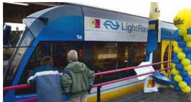
RGL West nu dan echt in Noordwijk?