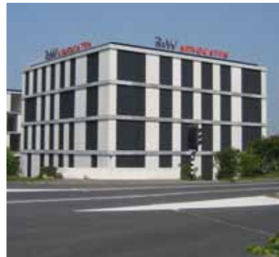
Het nieuwe kantoorpand van RWV Advocaten in Leiden

RWV Advocaten te Leiden en Noordwijk, heeft haar intrek genomen in een nieuw kantoorpand. RWV maakte de laatste jaren een aanzienlijke groei door. Het nieuwe kantoor biedt meer ruimte en bevindt zich op een prominente plek in Leiden; op de Haagweg. Naast de vestiging in Leiden blijft de Noordwijkse locatie, die al sinds medio 2003 aan de Jonckerweg 2 is gevestigd, natuurlijk gehandhaafd.