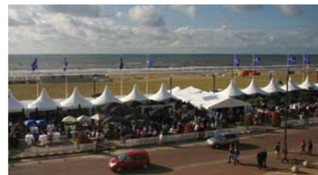
Op 21, 22 en 23 augustus wederom een waar Noordwijkse culinair festijn!

Na de eerste succesvolle editie van een culinair festival op de Noordwijkse Koningin Wilhelmina Boulevard was het duidelijk: dit smaakt naar meer! Liefhebbers van lekker eten en drinken kunnen in augustus weer aanschuiven bij één of meerdere tafels van de deelnemende restaurants. Ook zullen er weer bijzondere Masterclasses, kookdemonstraties door meester-koks en proeverijen op het programma staan. Nieuw dit jaar: amateur koks die hun beste recept presenteren en meedingen naar de titel en bijbehorende prijs van 'Chefkok aan Zee'. Het beloven weer 'smaakvolle' dagen te worden. Meer info: www.culinairaanzee.nl.