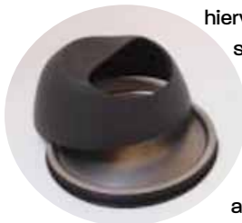
De stormvaste asbak voor uw terras

De lekkerste 100%o Halal frikadel is geschikt voor iedere veel-eisende consument in onze multiculturele en moderne samenleving. Of er nu wel of geen economische crisis aan de gang is: Innovatie is het toverwoord. Nieuwe, slimme oplossingen zijn een inspiratiebron om extra omzet te genereren of minder kosten te maken. Niet bij de pakken neerzetten, maar de bedreigingen die er zijn proberen om te zetten in kansen. Een duidelijk voorbeeld